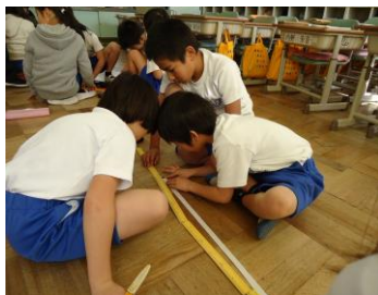
2年生は長さの学習をしました。仲間と一緒に測ってみました。