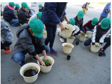
5年生が卒業式に飾るパンジーの苗を鉢に植え替えました。