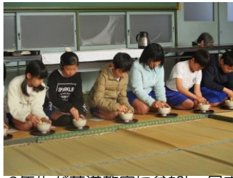
3年生が茶道教室に参加し、日本の伝統的な文化を学びました。