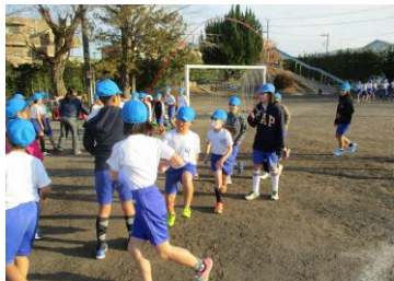
5年生が卒業式に飾るパンジーの苗を鉢に植え替えました。

一年で寒さが最も厳しい時期を迎えていますが、子どもたちは、8の字集会や縦割り活動等の場で仲間と関わって高め合い、成長しています。また、それぞれの学年では、まとめの学習や体験的な学習を着実に積み重ね、次の学年に向かって意欲をもって生活する姿が見られます。頼もしい姿を13日(水)の参観会で、ぜひご覧ください。