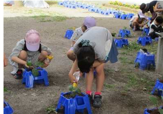
2年生：野菜の苗を植え付けています。大きくなあれ。