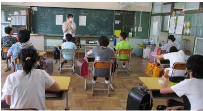
6年生：家庭学習の進め方について確認しています。

感染予防に配慮した中で、課題等の集配の他、種や野菜の苗の植え付け、運動場での外遊びなどを行いました。季節外れの暑さで熱中症等が心配されましたが、子供たちは友達や先生と過ごす時間を楽しんでいるようでした。25日からは、6月1日の学校再開に向けて在校時間を延ばすとともに、回数を増やし、一週間に2回の登校としました。休校期間が長期化したため、疲れを見せる子供もいたようです。学校再開後も少しずつ段階を踏んで、通常の学校生活に戻していきたいと思っております。引き続き、ご理解、ご協力をお願いいたします。