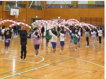
【ランドセルから飛び出すメッセージ】 【花のアーチでお見送り】