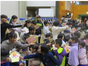
【1年生から6年生へ、呼び掛け、歌、手作りのプレゼント】