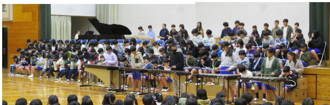
6年生合奏 「エル・ クンバンチェロ」

6年生からのお礼は、合奏でした。100人を超える6年生の合奏は、下級生はもちろん、教職員の心にも響き渡る素敵で迫力のある演奏でした。さすが6年生!!後は、卒業に向けて最後のまとめです。バトンをしっかりと引き継いでほしいと思います。