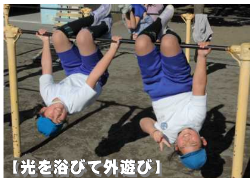
【光を浴びて外遊び】

授業では45分間、いすに座り、集中して話を聞いたり、文字を書いたりしています。ずっと集中し続けるというのは、難しいことです。そこで、効果的なのが「外遊び」で発散することです。「発散」と「集中」は、表裏一体です。上手に「発散」した後は、質の高い「集中」が期待できます。