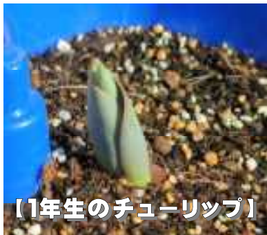
【1年生のチューリップ】

「立春」を迎えると、日の光が明るく、暖かくなってきます。春夏秋冬の中で「春」だけに、「日」が含まれています。そんな日射しを待っていたかのように、1年生が植えたチューリップも芽を出してきました。