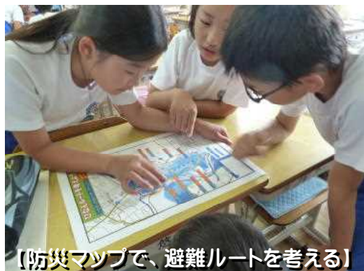
【防災マップで、避難ルートを考える】

あと少しで梅雨が始まります。豊富な水は、私たちの暮らしに豊かな実りをもたらしてくれます。狩野川の流れに感謝しつつも、いかにしたら被害を最小限にとどめ、子供の命を守ることができるのか、一緒に考えていきましょう。