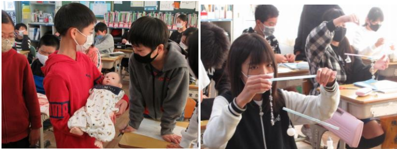
5年：人のたんじょう(理科) 6年：てこのはたらき(理科)