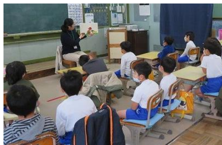
6・7・8組 ボランティアによる 読み聞かせ