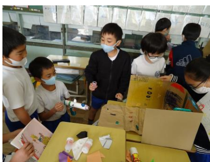
2年: 動く動くわたしの おもちゃ(生活)