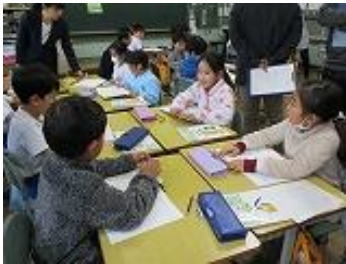
2年生は「足し算と引き算の関係」を友達と話し合い、理解しました。