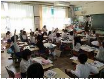
4年生は「命とからだのはなし」を

一年で寒さが最も厳しい時期を迎えていますが、子供たちは、日々の授業や縦割り活動等の場で仲間と関わって高め合い、成長しています。また、それぞれの学年では、まとめの学習や体験的な学習を着実に積み重ね、次の学年に向かって意欲をもって生活する姿が見られます。頼もしい姿を14日(金)の参観会で、ぜひご覧ください。