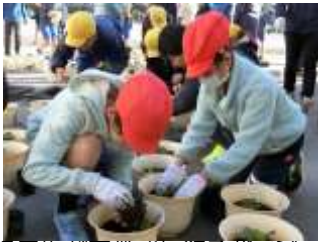
5年生が卒業式に飾るハンゾーの苗を鉢に植え替えました。