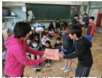
6年生から5年生に、縦割りリーダーを引き継ぎました。